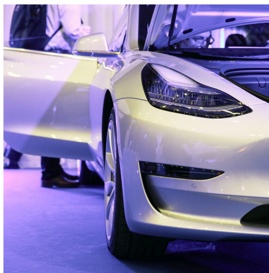
In der Future Zone der PIAE 2019, vom 03. - 04. April in Mannheim, präsentierten Autobauer Konzeptfahrzeuge zum Anfassen.